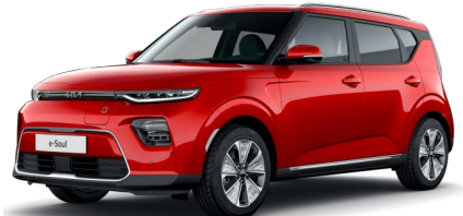
Červená Inferno (AJR)