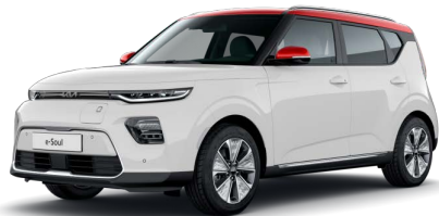
Bílá Clear + Červená Inferno (střecha) (AH1)