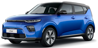
Modrá Neptune + Černá Cherry (střecha) (SE2)