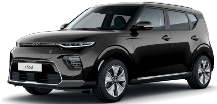
Černá Cherry (9H)