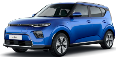
Modrá Neptune (B3A)