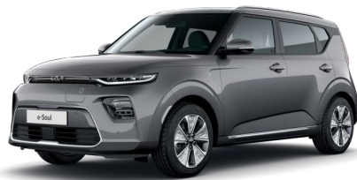
Šedá Gravity (KDG)