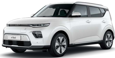
Perleťová Bílá Snow (SWP)