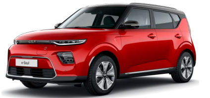
Červená Inferno + Černá Cherry (střecha) (AH4)