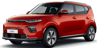
Oranžová Mars (M3R)