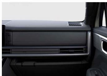
Prémiový černý Calligraphy interiér - černé čalounění sedadel z prémiové Nappa kůže - černé čalounění stropu - černé provedení bočních sloupků - černé provedení výplní dveří