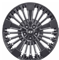
Calligraphy 20" kola z lehké slitiny