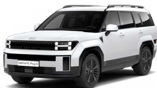
Creamy White Matná Cena: 34 900 Kč