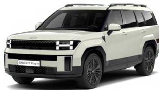
Cyber Sage Perleťová Cena: 24 900 Kč