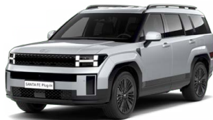
Typhoon Silver Metalická Cena: 19 900 Kč