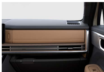
Hnědý Pecan Brown interiér - hnědé čalounění sedadel - černé čalounění stropu - černé provedení bočních sloupků - hnědo-černé provedení výplní dveří