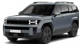
Pebble Blue Perleťová Cena: 24 900 Kč