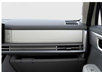
Šedý Supersonic Gray interiér - šedé čalounění sedadel - světlé čalounění stropu - světlé provedení bočních sloupků - šedé provedení výplní dveří