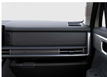
Černý Obsidian Black interiér - černé čalounění sedadel - světlé čalounění stropu - světlé provedení bočních sloupků - černé provedení výplní dveří