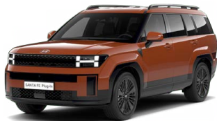
Terracota Orange Pastelová Cena: 0 Kč