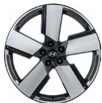
20" kola z lehké slitiny