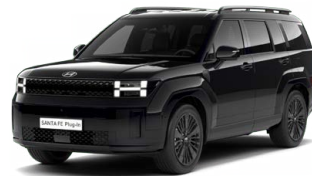
Abyss Black Perleťová Cena: 24 900 Kč