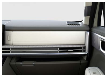
Tmavě zelený Forest Green interiér - krémové čalounění sedadel - světlé čalounění stropu - světlé provedení bočních sloupků - tmavě zelené provedení výplní dveří