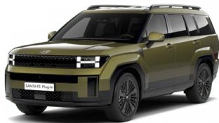
Ocado Green Perleťová Cena: 24 900 Kč