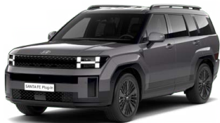
Magnetic Gray Metalická Cena: 19 900 Kč