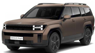
Earthy Brass Matt Matná Cena: 34 900 Kč