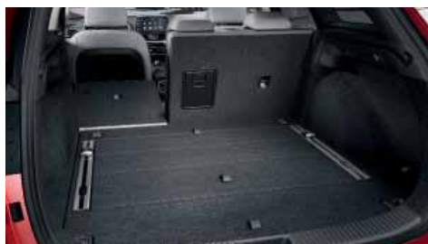
Zadní sedadla dělená a sklopná v poměru 60:40

Otevření zadního víka zpřístupní další přednosti nového modelu i30 kombi, které možná nejsou na první pohled patrné. Objevíte obrovský zavazadlový prostor o objemu 602 l, který lze sklopením opěradel zadních sedadel zvětšit na velkorysých 1 650 l. Díky této vrozené všestrannosti je i30 kombi ideálním partnerem pro Vaše rodinné výlety, volnočasové aktivity nebo podnikání. Ať už Vás osud zavede kamkoli, vždy budete vědět, že do svého cíle přijedete ve velkém stylu.