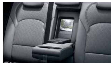
Zadní středová loketní opěrka a průvlak pro přepravu lyží