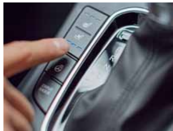
Odvětrávaná sedadla čalouněná kůží