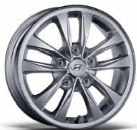
15" kola z lehkých slitin