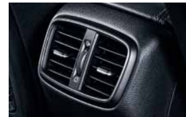
Zadní ventilační průduchy