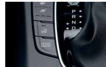
Volič jízdních režimů