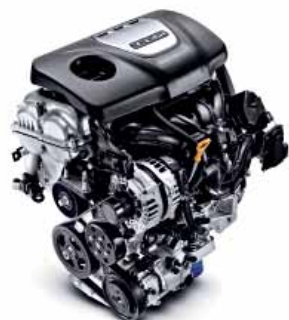
T-GDI 120 88 kW