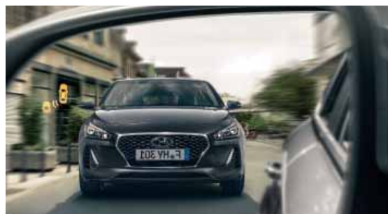
Sledování mrtvého úhlu BSD (Blind-Spot Detection) upozorňuje vizuálně i akusticky na přítomnost zezadu se blížících vozidel.

Nová generace i30 kombi poskytuje všem cestujícím naprostý pocit bezpečí. Systém sledování únavy řidiče vyhodnocuje chování řidiče a detekuje jakýkoli náznak ztráty jeho pozornosti, která by ohrozila bezpečnost jízdy. Mezi další vyspělé bezpečnostní systémy patří autonomní nouzové brzdění, inteligentní adaptivní tempomat a asistent pro vedení vozu v jízdách pruzích.