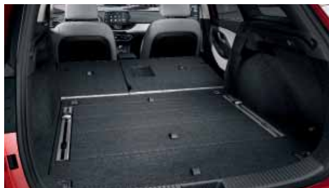
Velký zavazadlový prostor