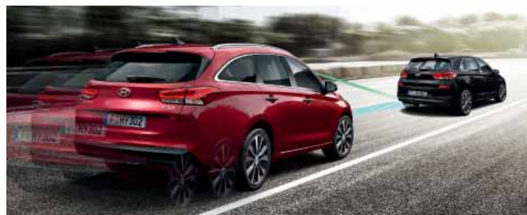
Autonomní nouzové brzdění AEB (Autonomous Emergency Braking) s funkcí detekce chodců používá částečný nebo maximální brzdný výkon, pokud hrozí potenciální kolize.