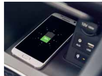
Bezdrátové nabíjení chytrých telefonů*

* Nekompatibilní chytré telefony vyžadují pro bezdrátové nabíjení adaptér.