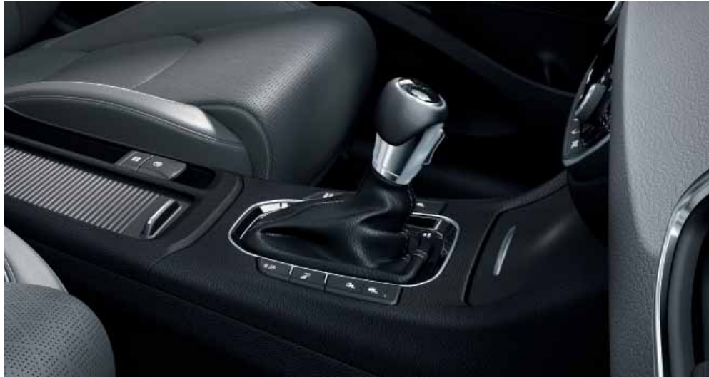
7stupňová dvouspojková převodovka

Přepíňované zážehové motory a 7stupňová dvouspojková převodovka poskytují novému modelu i30 kombi pozoruhodnou dynamiku. Na vrcholu nabídky stojí čtyřválec T-GDI 140 s výkonem 103 kW. K dispozici je také motor T-GDI 120 s výkonem 88 kW a turbodiesel CRDi ve výkonových verzích 85 a 100 kW. Společně se strmějším řízením, agilní ovladatelností a rozsáhlým využitím lehké ultravysokopevnostní oceli přispívají k podmanivým zážitkům z jízdy.