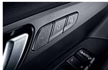
Integrovaná paměť nastavení sedadla řidiče