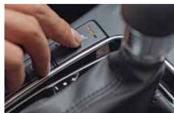
Vyhřívání předních sedadel