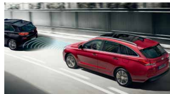
Inteligentní adaptivní tempomat ASCC (Advanced Smart Cruise Control) udržuje nastavenou vzdálenost od vpředu jedoucího vozidla a v případě potřeby automaticky snižuje nebo zvyšuje rychlost jízdy.