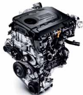
CRDi 115 / CRDi 136 85 kW / 100 kW