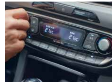
Dvouzónová automatická klimatizace