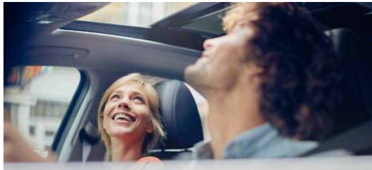
Panoramatické střešní okno

Klidná sofistikovanost interiéru potvrzuje dojem kvality, elegance a prostoru, který je dále umocněn velkým panoramatickým střešním oknem. Elektrická parkovací brzda ovládaná tlačítkem uvolnila místo na středové konzoli. Prostorný interiér má dostatek užitečných odkládacích schránek, které jsou ideální pro rodinné výpravy. Sedadla vpředu nabízejí jak vyhřívání, tak odvětrávání, zatímco cestující na sedadlech vzadu mají k dispozici vlastní průduchy ventilační soustavy přivádějící teplý nebo studený vzduch.