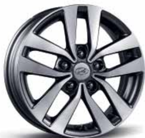
16" kola z lehkých slitin