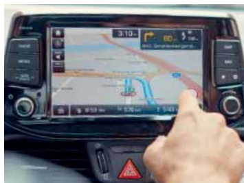
8" dotykový displej navigačního systému