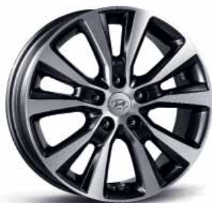
17" kola z lehkých slitin