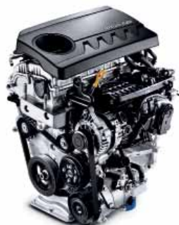
T-GDI 140 103 kW