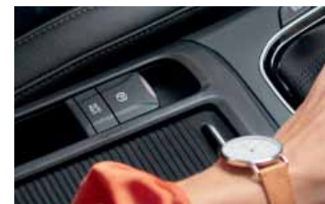
Elektrická parkovací brzda