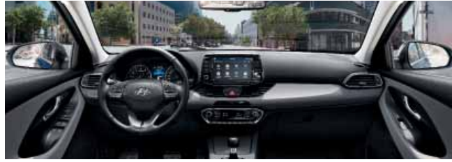
Dvoutónový černošedý interiér