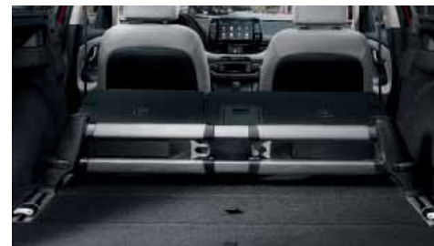
Fixační posuvný systém v zavazadlovém prostoru