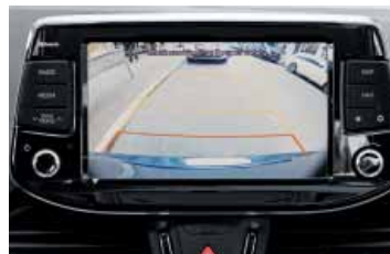
Zadní parkovací kamera